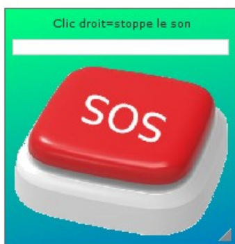
aspect au clic

En mode survol, une jauge marque une temporisation avant déclenchement du son.